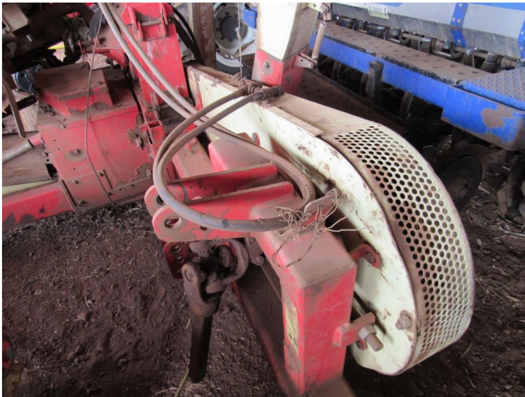
Figura 2 – Acoplamento.