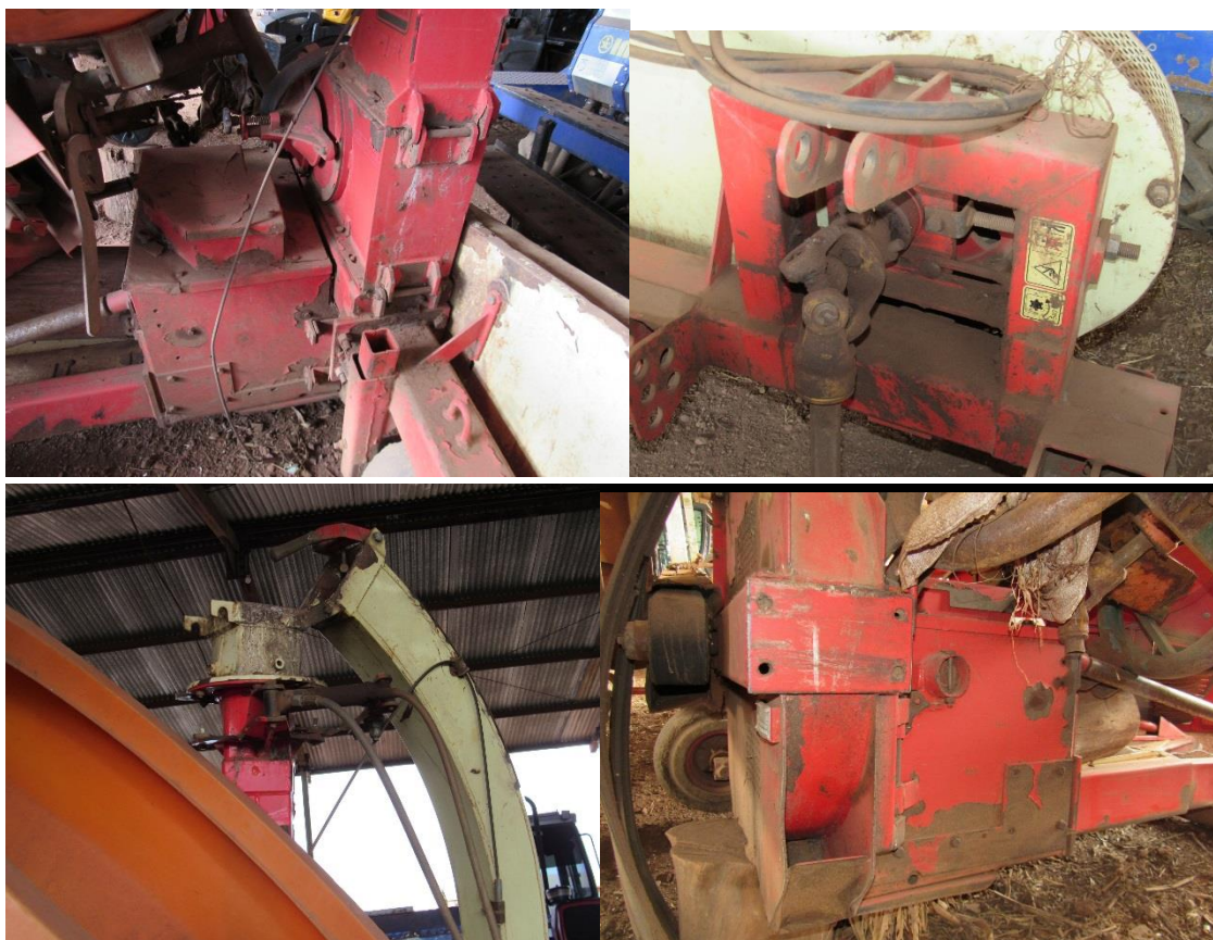
Figura 4 – Estrutura no geral