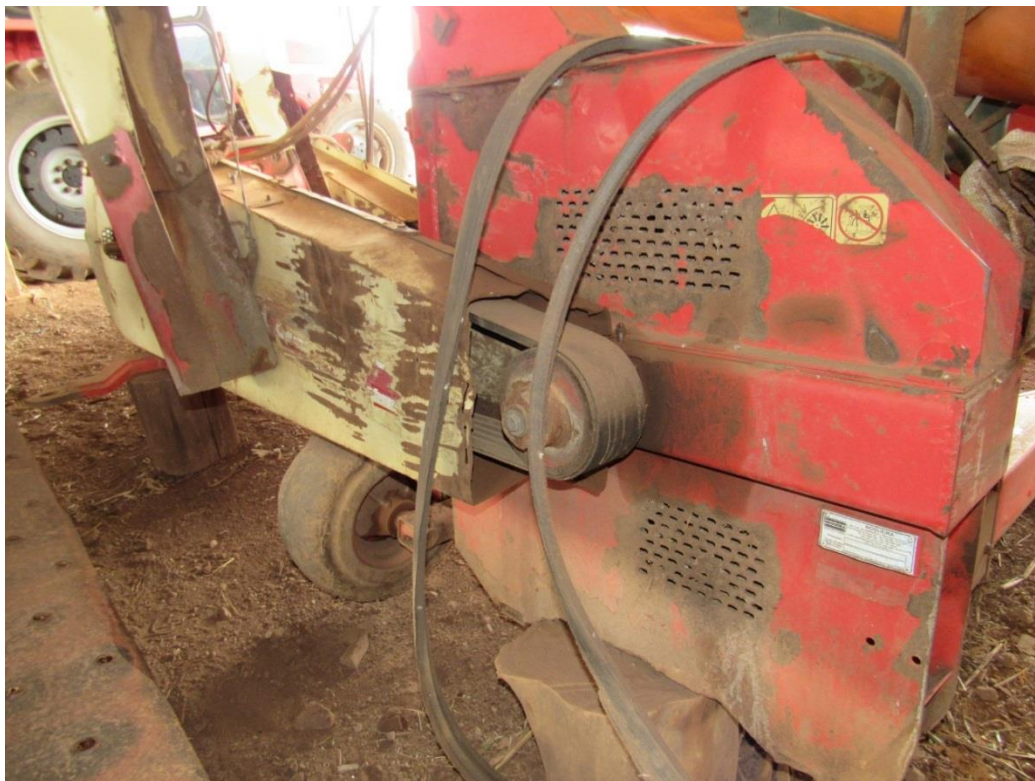
Figura 3 – Proteção da correia